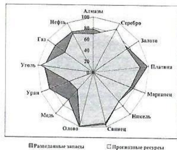
Рис. 1. Удельный вес восточных регионов страны в прогнозных ресурсах и разведанных запасах полезных ископаемых, %

В силу этого восточные регионы России являются главными поставщиками нефти, природного газа, угля, редких и цветных металлов, золота, серебра, алмазов. Созданные в Сибири и на Дальнем Востоке топливно-энергетические и горнометаллургические промышленные комплексы вносят существенный вклад в обеспечение экономического роста страны, в форми-