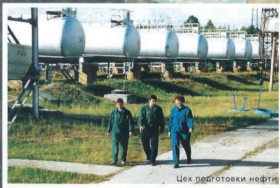
Цех подготовки нефти