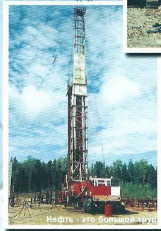
Нефть - это большой труд