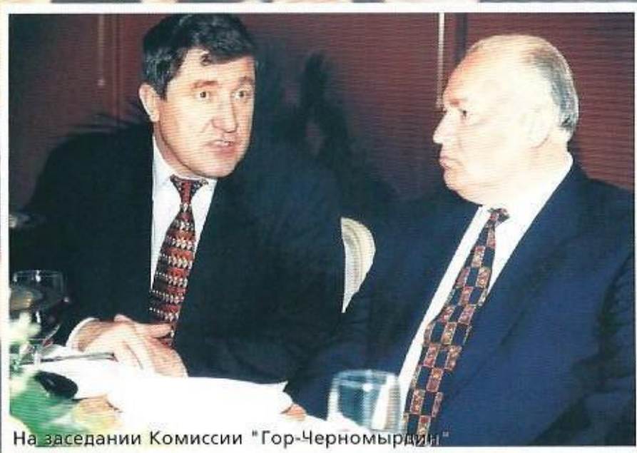
На заседании Комиссии «Гор-Черномырдин»